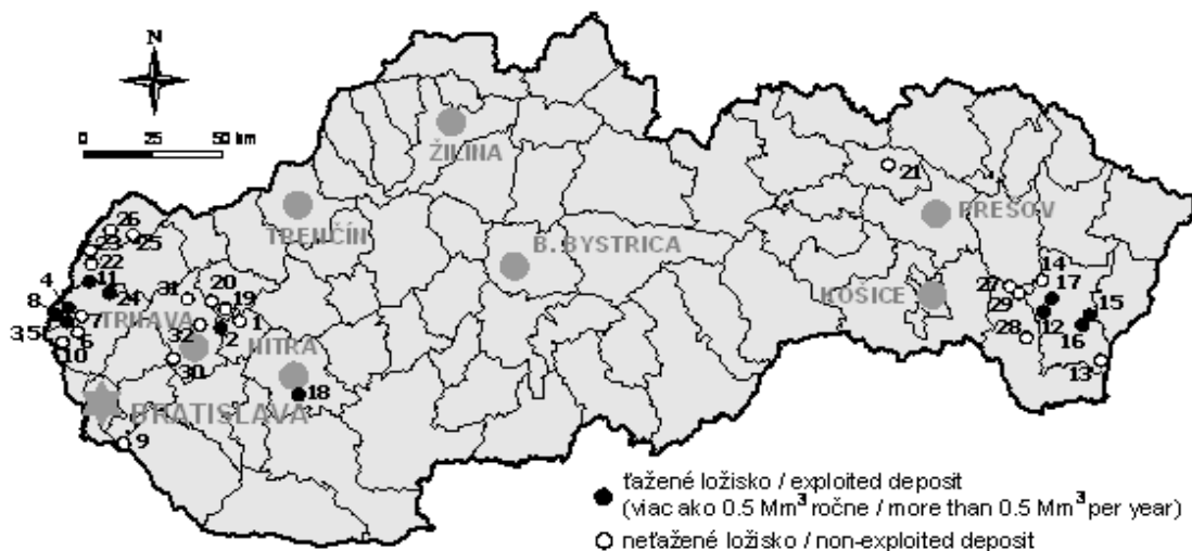
Obr. 2. Ložiská zemného plynu na Slovensku (podľa [10] upravil autor)

Legenda: 1 - Madunice, 2 - Trakovice, 3 - Jakubov - Dúbrava, 4 - Gajary - bádén, 5 - Jakubov, Jakubov - juh, 6 - Láb, 7 - Malacky, 8 - Suchohrad - Gajary, 9 - Šamorín, 10 - Vysoká, 11 - Závod (3 ložiská), 12 - Bánovce nad Ondavou, 13 - Ptrukša, 14 - Rakovec nad Ondavou, 15 - Senné, 16 - Stretava, 17 - Trhovište – Pozdišovce, 18 - Ivanka pri Nitre, 19 - Madunice, 20 - Nižná, 21 - Lipany, 22 - Borský Jur, 23 - Kúty, 24 - Studienka, 25 - Cunín, 26 - Gbely B - pole, 27 - Kravany, 28 - Trebišov, 29 - Višňov, 30 - Cífer, 31- Horná Krupá, 32 - Špačince (4 ložiská), 33 až 35 sú ložiská Palín, Lastomír a Žbince (nie sú zobrazené na uvedenej mape Slovenska).