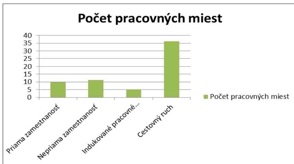
Obr. 2 Počet pracovných miest v sektore leteckej dopavy

Medzi indukované pracovné miesta patria zamestnania, ktoré sú priamo alebo nepriamo späté s odvetvím leteckej dopavy a podporujú pracovné miesta v priemysle ako sú maloobchodné predajne, firmy vyrábajúce spotrebný tovar a poskytujúce rad služieb (napríklad banky, reštaurácie, atď.). 5,2 milióna indukovaných pracovných miest po celom svete je podporovaných prostredníctvom zamestnancov v odvetví leteckej dopavy. Väčšina príjmov je využívaných na nákup tovaru a služieb pre svoju vlastnú potrebu. Indukovaný príspevok ku globálnemu HDP je 175 miliónov amerických dolárov. [1]